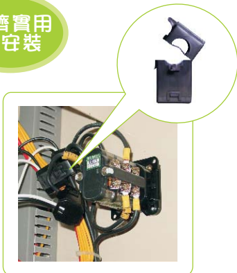
Split Core CT,不停電安裝